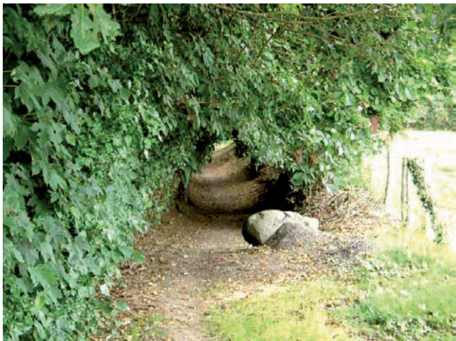
Chemin de Bonnefond

Un peu d'histoire sur Mézières-sur-Issoire... Etymologiquement « macerías » murdilles, ruines, son nom rappelle le souvenir d'anciennes constructions antiques.